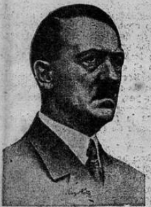
Hitler quien firmó hoy trascendental convenio con Chamberlain para asegurar la paz de Europa.

El mejoramiento de las relaciones entre Gran Bretaña y Alemania es una necesidad que resultará en provecho de las dos naciones y de la paz de Europa en general, declaró Chamberlain a la United Press, al salir de su conferencia con Hitler