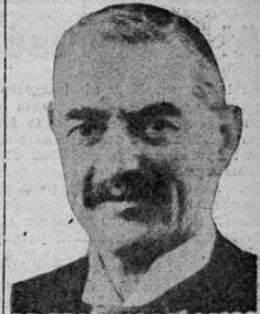
Chamberlain quien firmó hoy trascendental convenio con Hitler para asegurar la paz de Europa.